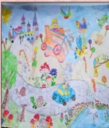
Радовановић Лена 5-1