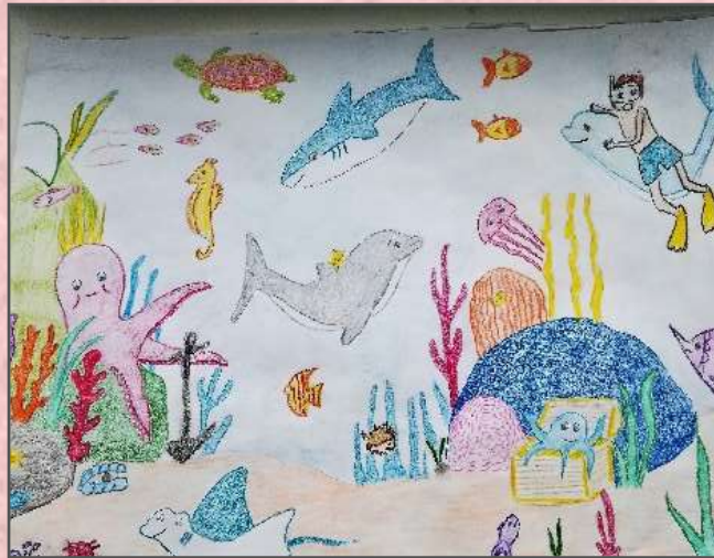
Рајачић Стефан 3-2