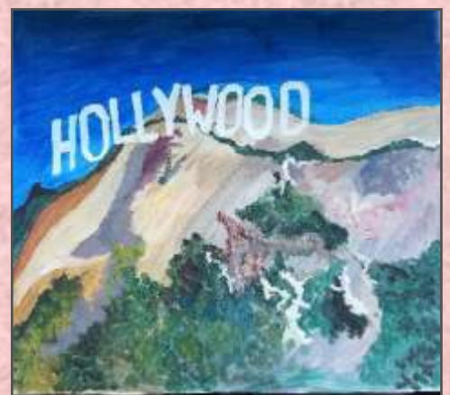
Симовић Тара 7-1